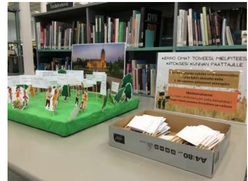
Osallistava mielenilmaus Joensuun pääkirjastolla kesällä 2023

Demokratia Vaarassa -hankkeen hankeaikaa jatkettiin vuoteen 2024.