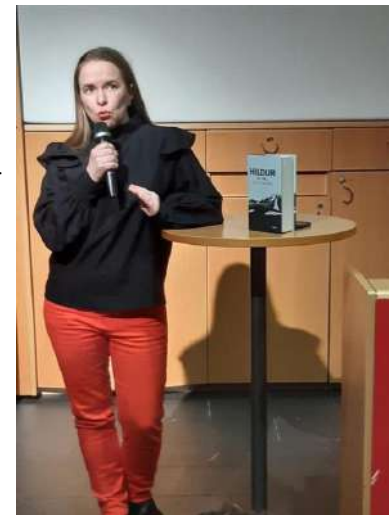
Satu Rämö kirjaston vieraana Carelicumissa helmikuussa