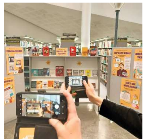
Sinulle on postaus: interaktiivinen näyttely

Lisäksi hankkeessa pilotoitiin faktantarkistuksen sekä verkkokeskustelun työpajoja, mutta heikon toistettavuutensa vuoksi ne eivät päätyneet yhteisiksi materiaaleiksi. Hankkeessa tuotettiin Sinulle on postaus -niminen interaktiivinen näyttely, joka on suunniteltu toimivaksi myös esimerkiksi omatoimijalla.