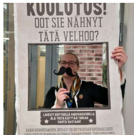
Harry Potter -tapahtuma Ylämyllyllä