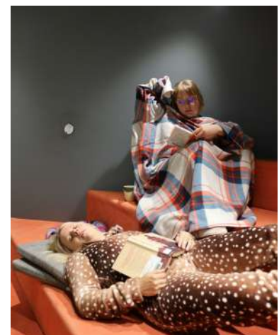
Väsyneiden lukupiirin syyskauden mainoskuva

Reijolassa hyödynnettiin elokuvalisenssiä muiden näytösten lisäksi lukupiirissä eli lukupiiriläiset katsoivat luettujen kirjojen pohjalta tehtyjä elokuvia. Novellikoukkuja järjestettiin Lehmassa, Kontiolahdella, Liperissä ja Pyhäselässä. Lisäksi Rantakylän kirjastossa kokoontui kädentaitajien käsityökerho omatoimisesti kerran viikossa.